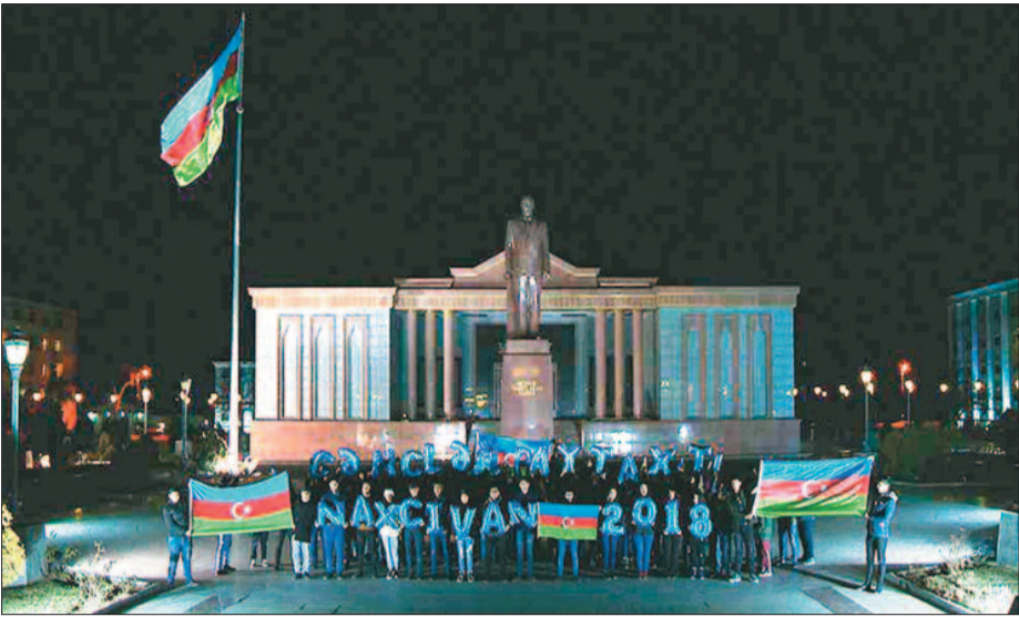
1998-ci il avqustun 12-də Portuqaliyanın paytaxtı Lissabon şəhərində gənclərlə iş sahəsində keçirilən beynəlxalq konfransda hər il avqustun 12-nin dünyada "Gənclər Günü" kimi qeyd olunması qərara alınmışdır. Həmin tarixdən etibarən Beynəlxalq Gənclər Günü Azərbaycanda da qeyd olunur.

Sağlam gənc nəslin yetişdirilməsi hər bir ölkə üçün əsas məsələdir. Çünki ölkənin gələcəyi, müqəddəratı gənclərdən asılıdır.